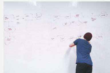
Responsable de Gestión de Procesos en Sistemas Informáticos