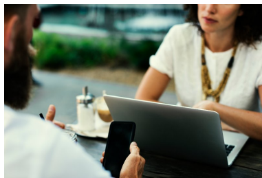
Responsable de Proyectos