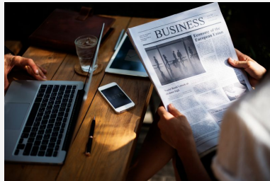
Director y Gestor de RRHH

La realización del Máster de Formación Permanente en Digitalización de RRHH permitirá realizar el desempeño de diferentes labores como las que se indican a continuación: